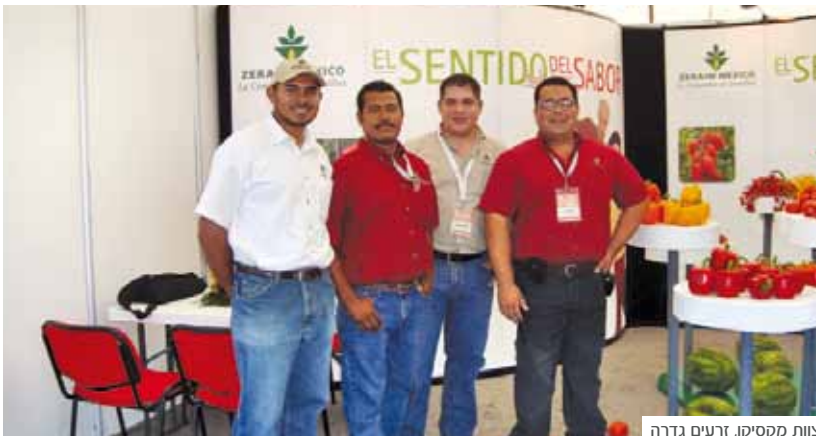
צוות מקסיקו, זרעים גדרה

לראשונה, הציגה זרעים גדרה קו שלם של מוצרים הן של עגבניות והן של זני פלפל בלוקי צבעוני, המתאימים לכל אחד מאזורי הגידול העיקריים במקסיקו. יתר על כן, המומחים שלנו פועלים בקרבה לשוק על מנת להבין את צורכי הלקוח לאורך שרשרת השיווק. אירוע מסוג זה הנו אמצעי שיווק מעולה המקדם את המותג זרעים גדרה בצפון אמריקה ומחזק את מוניטין החברה.