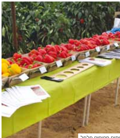
ימים פתוחים פלפל