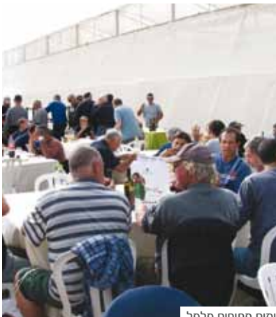
ימים פתוחים פלפל