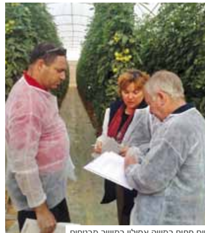
יום פתוח במשק אסולין במושב מבטחים

גם ביום פתוח זה התלוויתי לצוות המקצועי בהדרכות השונות שערכו לכם, החקלאים. וגם כאן למדתי רבות עליכם ועל הזנים המעניינים אתכם, אז אני מקווה שלא תסמיקו כמו עגבנייה, אבל זה מקצת מה שגיליתי: