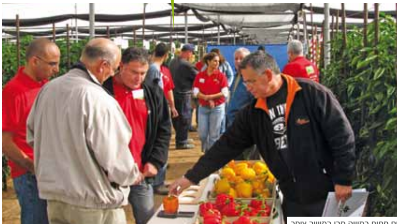
יום פתוח במשק סבן מושב צופר

אורית נעים-פרי / מתאמת מרקום / orit.npery@zeraim.com