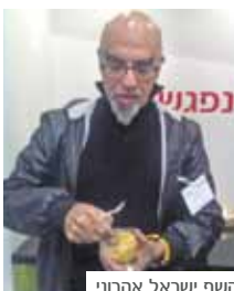
השף ישראל אהרונ

במטרה לחשוף את הציבור הישראלי לטעמו המעודן והמיוחד של התירס, הצגנו את המוצר לטעימה בתערוכת אגרו משב 2010. המבקרים בביתן קיבלו קופסה אישית ובה גרעיני תירס מתוק טבעי מן SuperSweet. בין הטועמים נמנו מגדלים, יצואנים, סיסונאי תוצרת טרייה, כמו גם אנשי קשר קיימים וחדשים, שמתגובותיהם הנדהמות למדנו שמאחורי מיתוג זה יש הבטחה אמיתית. בין מבקרי התערוכה נמנה גם השף אהרונ, שלא פסח על ביתן זרעים גדרה, ולאחר שטעם את התירס אף הפליג בדבריו לתאר את זני התירס SuperSweet כבעלי טעם מושלם ועסיסיות המתאימה בדיוק למתכונים הנפלאים. המוצר מתאים לשיווק הן לתעשייה והן לשוק הטר, וחברת זרעים גדרה שמה לה למטרה לקשר בין ערוצי השיווק לבין המגדלים כך שכל בית בישראל יוכל למצוא עוד השנה את זני התירס המתוק הטבעי SuperSweet במדפי רשתות השיווק.