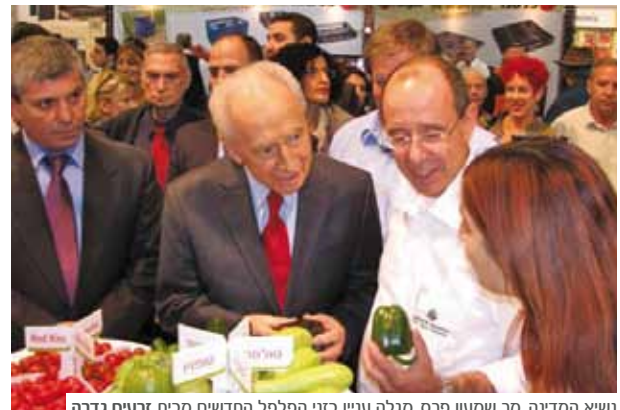
נשיא המדינה, מר שמעון פרס, מגלה עניין בזני הפלפל החדשים מבית זרעים גדרה

ע שור חדש נפתח ועימו שאיפות והזדמנויות חדשות. שוק החקלאות כבר מזמן לא מבוסס על עבודת אדמה בלבד, אלא משלב פתרונות טכנולוגיים ומדעיים הבאים להתמודד עם השינויים היומיומיים בכלכלה העולמית. וככל עסק כלכלי, גם כאן חשוב לא לנוח על זרי הדפנה, אלא להתעדכן כל הזמן בחידושים ובפיתוחים השונים שמציעות החברות השונות.