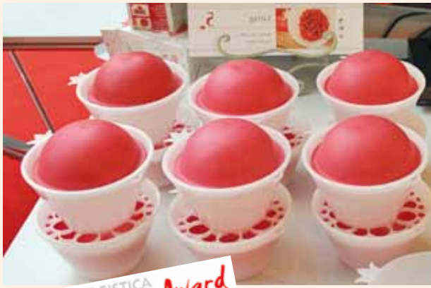
FRUIT LOGISTICA Innovation Award 2010

חברת מהדרין תנופורט, בשיתוף עם חברת מרים שוהם בע"מ זכו במקום הראשון בתחרות מוצרים חדשניים (Innovation Award) בתערוכת Fruit Logistica שנערכה בברלין בתאריכים 5-3 לפברואר. המוצר שזכה הינו כלי לפריטת רימונים (באנגלית נקרא ART- Removal Tool). מדובר בכלי פשוט שמטרתו לסייע באכילה של רימון טרי מבלי להתעסק עם אי הנעימות והלכלוך הכרוכים לעיתים באכילת הפרי.