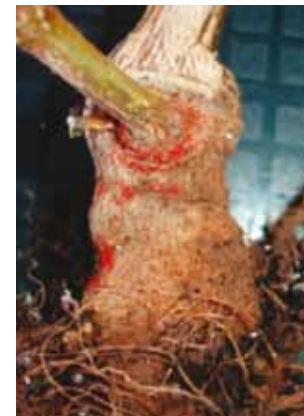
פטריית Fusarium Solani :