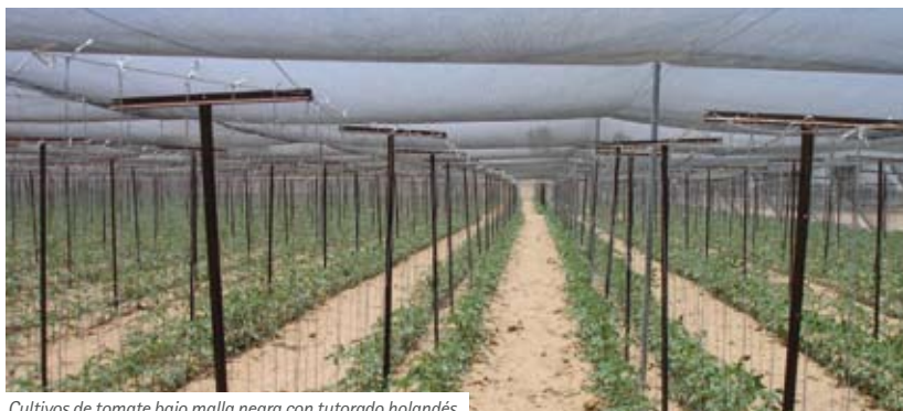
Cultivos de tomate bajo malla negra con tutorado holandés