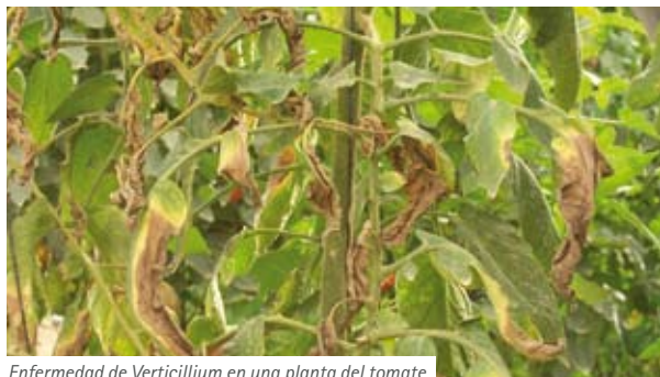
Enfermedad de Verticillium en una planta del tomate

Trips occidental de las flores (trips californiano) (Frankliniella occidentalis) / Esta plaga se está convirtiendo en dominante en el tomate y recientemente se ha observado en varias parcelas de tomate cubiertas con mallas anti-insectos 50 mesh en diversas regiones de Israel y en todo el mundo. También se han observado daños del TSWV que es transmitido por esta plaga (véase la fig. 4.). La mayoría de los daños se pueden ver en la primavera, cuando la población de trips en la naturaleza es alta, sin embargo cuando la población se establece en un invernadero, es probable que la actividad de los trips continúe en el verano también. Zeraim Gadera tiene varias variedades resistentes al TSWV que mantienen cualidades agrotécnicas de aceptación general, tales como Tovi Cala y Baron. En cualquier caso, es importante controlar la población de trips mediante la aplicación de plaguicidas como abamectina, spinosad y benzoato de emamectina.