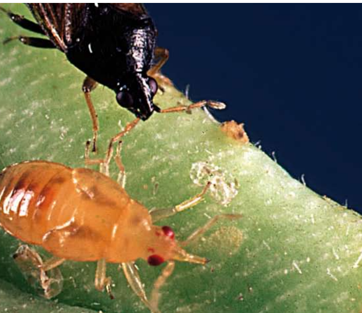
Orius laevigatus es un pequeño insecto depredador, con aparato bucal perforador-chupador y dos pares de alas. Desde 1991, varias especies de Orius se utilizan comercialmente en todo el mundo para el control de trips, especialmente del trips occidental de las flores (californiano).