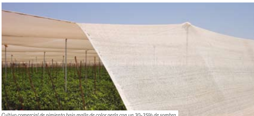
Cultivo comercial de pimiento bajo malla de color perla con un 30-35% de sombra