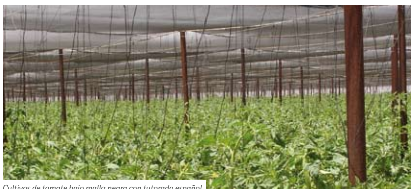
Cultivos de tomate bajo malla negra con tutorado español

horas de luz de día dentro de los rangos de microeinstein antes mencionados. Cuando los niveles de luz están por debajo de los niveles óptimos antes mencionados, la tasa de fotosíntesis disminuye y el rendimiento y la calidad sufren.