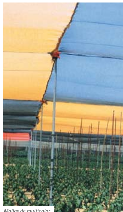
Mallas de multicolor

La luz utilizada en la fotosíntesis se llama radiación fotoactiva (PAR – photoactive radiation) y se mide en microeinsteins. Se dispone de fotómetros para medir la luz PAR. Los tomates dan buenos rendimientos