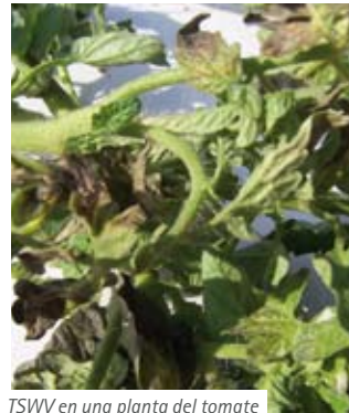
TSWV en una planta del tomate

es importante controlar la población de trips mediante la aplicación de plaguicidas como abamectina, spinosad y benzoato de emamectina.