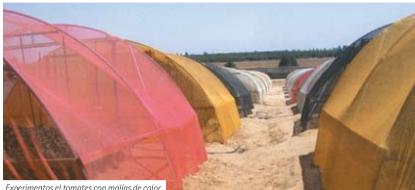
Experimentos el tomates con mallas de color

En los climas mediterráneos plantamos tomates y pimientos casi todo el año. En primavera y especialmente en verano se dan temperaturas muy altas. Por las altas cantidades de radiación solar. Estas condiciones pueden crear un alto grado de estrés tanto en las plantas de semillero como en las plantas adultas, dando como resultado una disminución del rendimiento. A lo largo de los años se han desarrollado métodos de sombreado para permitir a las plantas crecer en mejores condiciones y mejorar así la calidad y los rendimientos de los cultivos.